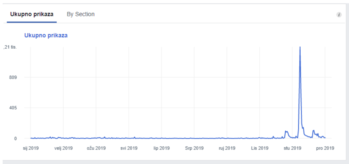
Slika 3 Statistika posjećenosti Facebook stranice Knjižnice FFOS-a u 2019. godini

Na mrežnim stranicama Knjižnice studenti mogu pronaći poveznice na različite slobodno dostupne elektroničke časopise s cjelovitim tekstom, koji su izdvojeni prema nastavnim planovima i programima pojedinačnih studija. Pristup radovima pohranjenim u repozitoriju DABAR (Digitalni akademski arhivi i repozitoriji) omogućen je uz korištenje osobnog AAI-korisničkog imena i lozinke. Najvažnije informacije o svom djelovanju Knjižnica također stavlja i na svoj profil na Facebooku . Prikaz statistike posjećenosti Facebook stranice Knjižnice u 2019. godini daje Slika 3.