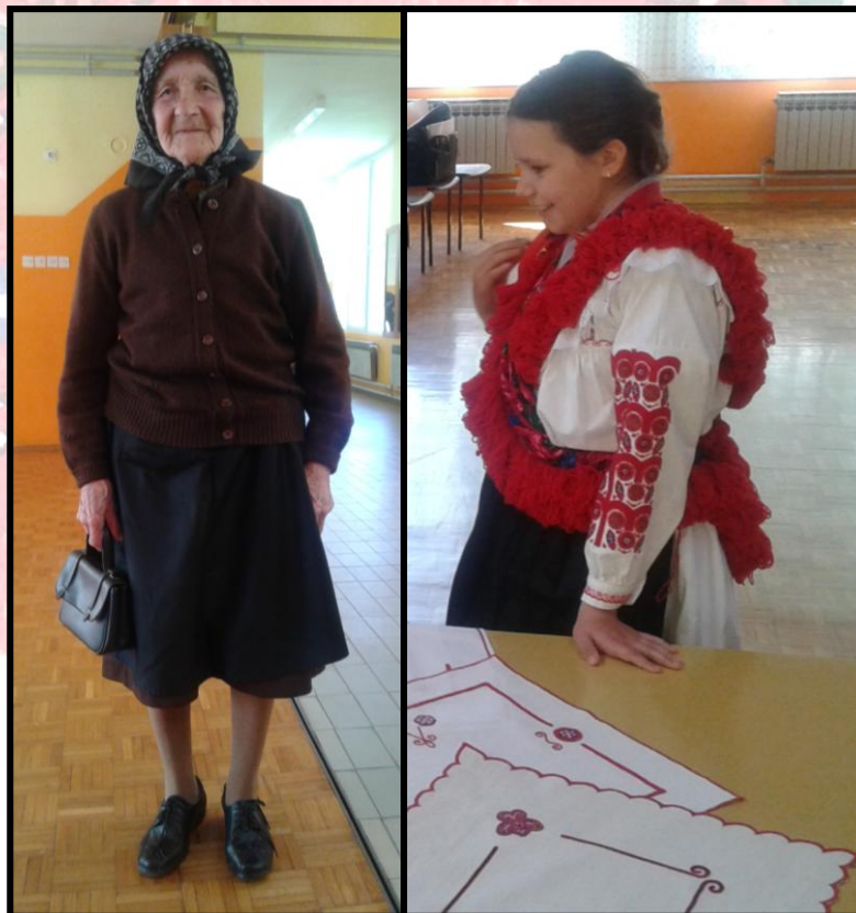
Najstarija i najmlađa kazivačica