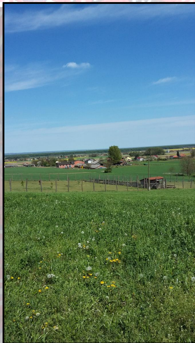
Pogled s „Jastrebova vrha“