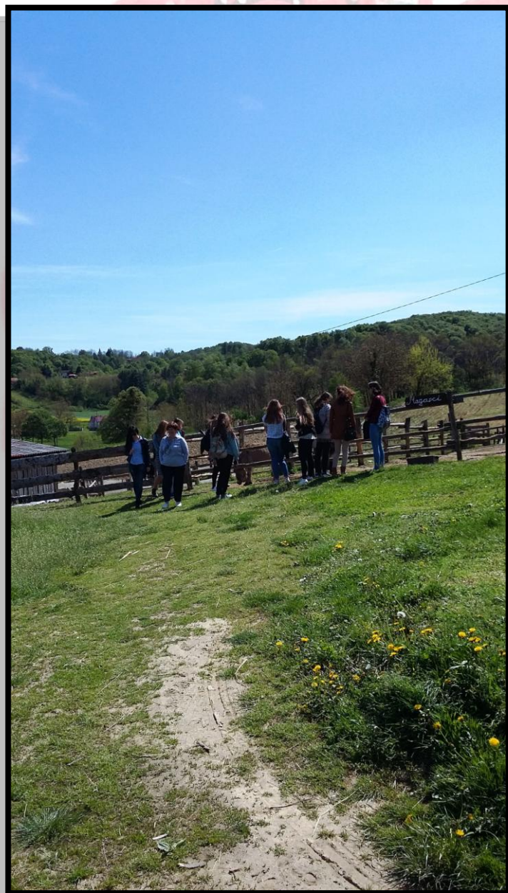
Studenti u obilasku zoološkoga vrta

Popodnevene sate studenti su proveli na Izletištu „Jastrebov vrh“ u blizini Koprivnice gdje su, između ostaloga, posjetili obiteljski zoološki vrt.